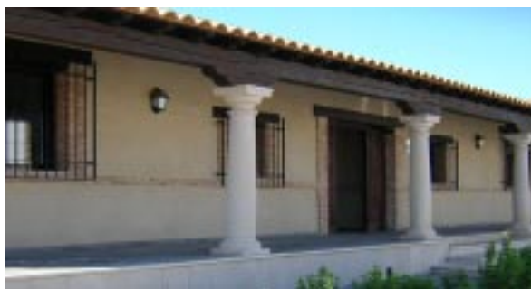
Observatorio Medioambiental en el Polígono Industrial "El Salobral"

El Programa dispone además de la página web www.biodiversidad-calatrava.com como acción de divulgación general, con el correo electrónico de referencia propymes@biodiversidad-calatrava.com .