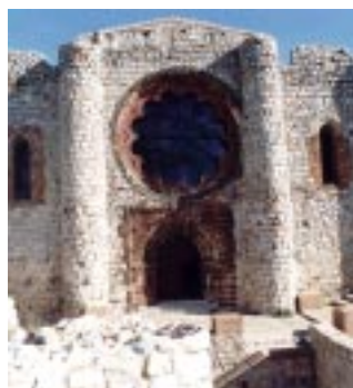
Una comarca con fuertes lazos de unión

Con el objetivo de propiciar el desarrollo rural de la comarca del Campo de Calatrava, desde la Mancomunidad de Municipios se apuesta por las acciones de formación, divulgación y orientación en materia medioambiental destinadas a los trabajadores de las Pymes y profesionales autónomos del territorio