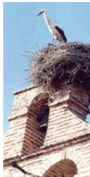
La Mancomunidad de Municipios y los Excmos. Ayuntamientos del territorio apuestan por un desarrollo rural compatible con la riqueza medioambiental del Campo de Calatrava